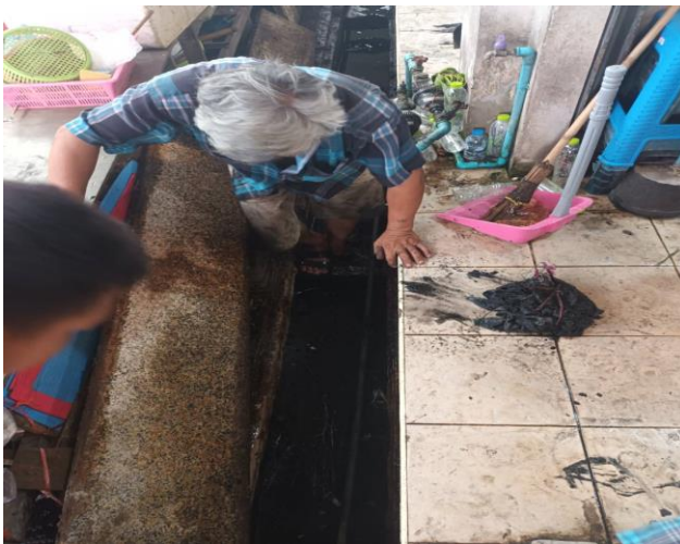
มีตะแกรงครอบทางระบายน้ำ