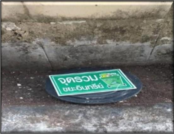
จุดรวมขยะอินทรีย์

การแยกขยะเศษอาหารลงในถังขยะเปียก ร้อยละ ๑๐๐ รณรงค์ห้ามใช้โฟมเป็นภาชนะบรรจุอาหาร ร้อยละ ๑๐๐