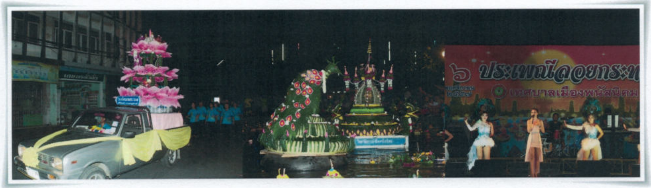
กิจกรรมงานประเพณีลอยกระทง

กิจกรรม เทศบาลเมืองพนัสนิคมได้จัดงานประเพณีลอยกระทงขึ้นเป็นประจำทุกปี มีคณะผู้บริหารเทศบาลเมืองพนัสนิคม หน่วยงานภาครัฐและเอกชน รวมไปถึงประชาชนในท้องถิ่น ซึ่งได้เข้าร่วมกิจกรรมอย่างต่อเนื่อง ภายในงานมีกิจกรรมการเดินขบวนแห่ การประกวดกระทงใหญ่ และได้จัดให้มีมหรสพการแสดง และกิจกรรมต่าง ๆ เช่นการแสดงดนตรีลูกทุ่ง การแสดงบนเวทีของนักเรียน และการทายใจภักดิ์ปราศรัย