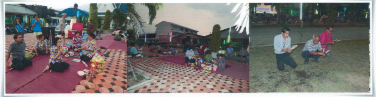
กิจกรรมงานประเพณีกองข้าว

ความสวยงามและจุดเด่นของงานนี้ขึ้นอยู่กับผู้คนที่จำนวนมากจัดสำรับกับข้าวตามฐานะมา ตั้งวง ร่วมรับประทานอาหารด้วยกันด้วยบรรยากาศ ฟืน้อง เสียงสรวลเสเฮฮา แลกเปลี่ยนอาหารกันรับประทาน ทำให้เกิดไมตรี จิตมิตรภาพสภาพจิตใจเป็นสุข เพราะได้ทำบุญสุนทาน เอื้อเฟื้อเผื่อแผ่ นี่คือนิยามของท้องถิ่นที่แปลกและหาดูกันได้ยาก จึงสมควรที่จะได้รับการฟื้นฟูอนุรักษ์และรักษาสืบทอดต่อไปชั่วลูกหลาน