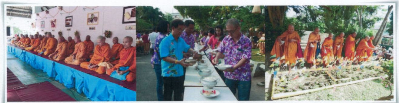
พิธีทำบุญตักบาตรและเสเดาะเคราะห์ต่อชะตาเพื่อความเป็นสิริมงคลแก่ครอบครัว

ประเพณีงานบุญกลางบ้าน จะกระทำกันในราวเดือน ๓ - ๖ โดยผู้เฒ่าผู้แก่ หรือชาวบ้านจะเป็นผู้กำหนดวันทำบุญกันเอง