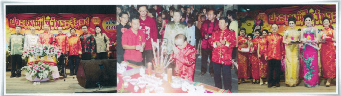
กิจกรรม งานประเพณีไหว้พระจันทร์

ประเพณีปฏิบัติเช่นนี้ ภายหลังได้แพร่หลายไปทั่วประเทศ และเป็นเทศกาลที่มีความสำคัญเทียบเท่ากับเทศกาลตรุษจีน และเทศกาลไหว้ขนมจ่าง (ขนมบ๊ะจ่าง)