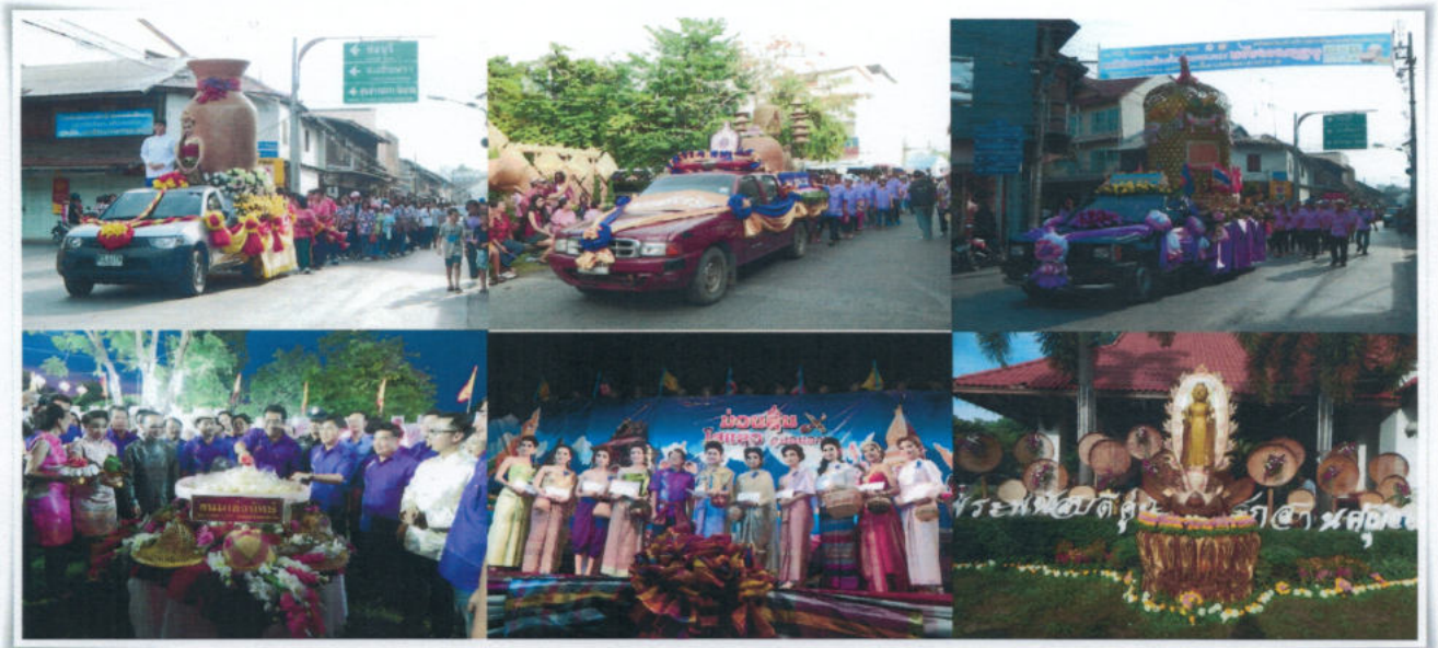
ขบวนแห่เครื่องจักสาน และพิธีเปิดงานบุญกลางบ้านและเผยแพร่เครื่องจักสานพนัสนิคม

สิ่งที่ได้จากการทำบุญกลางบ้าน ก็คือ ความสามัคคีในหมู่คณะ ความเห็นอกเห็นใจช่วยเหลือ เกื้อกูลซึ่งกันและกัน การรักษาไว้ซึ่งวัฒนธรรมประเพณีอันดีงามของท้องถิ่น ตลอดจนการปลูกฝังสิ่งที่ดีงามไว้ เป็นมรดกสืบ ทอดต่อไปถึงชนรุ่นหลัง