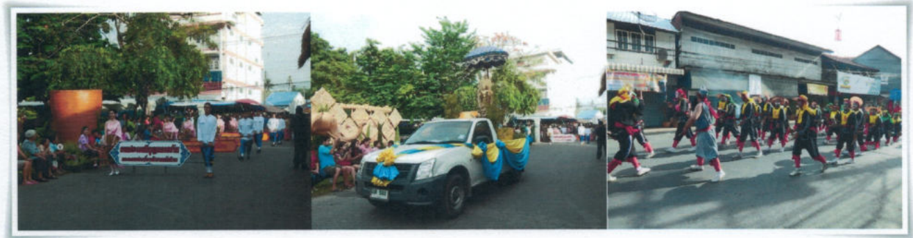
งานบุญกลางบ้านและเผยแพร่เครื่องจักสานพนัสนิคม

และมีการปฏิบัติเกี่ยวกับการทำบุญกลางบ้านต่อเนื่องกันมาจนยึดถือเป็นประเพณี คือ “ประเพณีงานบุญกลางบ้าน” แต่เพราะมีความแตกต่างด้านเชื้อชาติ ฉะนั้น ประเพณีงานบุญกลางบ้านในแต่ละพื้นที่ แต่ละแห่ง จึงมีความแตกต่างกันขึ้นอยู่กับความเชื่อและประเพณีดั้งเดิมของแต่ละเชื้อชาติ อย่างไรก็ตาม งานบุญกลางบ้านก็มีการสืบทอดวัฒนธรรมมานับร้อยปีตั้งแต่ครั้งปู่ ย่า ตา ยาย จวบจนปัจจุบัน