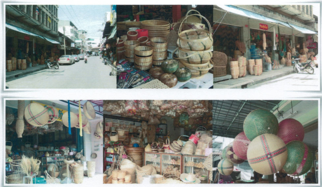
ตลาดเครื่องจักสาน

ต่อมาได้มีการพัฒนาเครื่องจักสาน โดยพัฒนาเป็นผลิตภัณฑ์ที่เน้นคุณภาพในการใช้งานความคิดสร้างสรรค์ ประณีต สวยงาม คงทน ทำให้เป็นที่แพร่หลาย ทำให้งานหัตถกรรมจักสานไม้ไผ่เมืองพนัสนิคม เป็นผลงานชาวบ้านที่สร้างชื่อเสียงให้แก่เมืองพนัสนิคม มีตลาดทั้งภายในและต่างประเทศซึ่งสามารถนำรายได้มาสู่ชาวพนัสนิคม ทำให้ประชาชนของอำเภอพนัสนิคมที่ประกอบอาชีพจักสานมีความเป็นอยู่ที่ดีขึ้น อีกทั้งยังมีขนมพื้นบ้าน อาหารพื้นบ้านที่อร่อย เช่นหมี่แดงแกงลาว ขนมกันถั่ว ฯลฯ หารับประทานได้ยาก และจะเห็นได้จากของดีเมืองพนัสนิคมที่ปรากฏอยู่ในคำขวัญของอำเภอพนัสนิคม คือ “พระพนัสบดีคู่บ้าน จักสานคู่เมือง ลือเลื่องบุญกลางบ้าน ตำนานพระรถเมรี ศักดิ์ศรีเมืองสะอาด เก่งกาจการทนายโจ๊ก” ส่วนใหญ่เป็นสิ่งที่เกิดขึ้นและเป็นอยู่ในเขตเทศบาลเมืองพนัสนิคมทั้งสิ้น ในการพัฒนาให้เมืองพนัสนิคมเป็นที่รู้จักกันอย่างแพร่หลาย มีผู้คนเข้ามาท่องเที่ยวอย่างสม่ำเสมอ